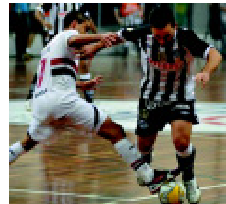
São Paulo e Santos se enfrentam na semi