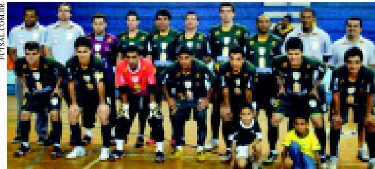
Sertãozinho faturou o título com vitória nos dois jogos finais

No jogo da volta, dia 17 de setembro, em Sertãozinho, o placar foi mais apertado. O Sertãozinho saiu do primeiro tempo vencendo por 2 a 0, abriu para 3 no segundo tempo, mas permitiu o empate do Indaiatuba, que precisava vencer no tempo normal e na prorrogação pra levantar o caneco. Porém, foi o