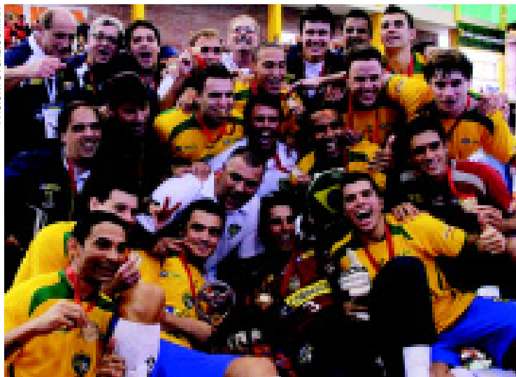
Brasileiros comemoram na Argentina o 19º título de Copa América

conquista da Copa América e cada um teve sua parcela de responsabilidade no título”, disse.