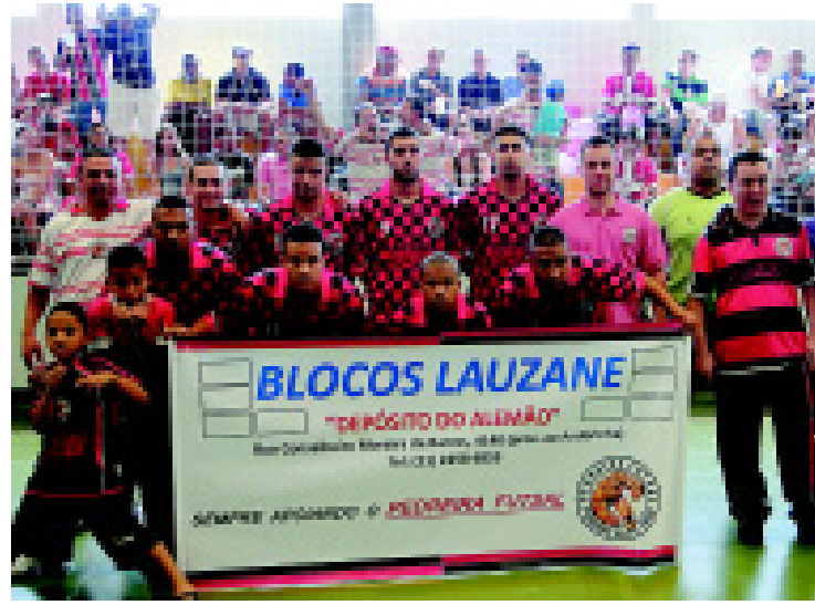
O Pedreira levou sua torcida a loucura com mais esse título