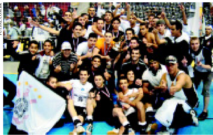
Equipe juvenil do Corinthians/São Caetano no Parque São Jorge