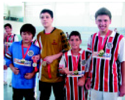
7 de Setembro é premiado em Ubatuba

As delegações ficarão hospedadas no Água Doce Praia Hotel, situado na Praia Dura. Os jogos de futsal serão disputados no ginásio do Colégio Nativa, no Bairro Sertão da Quina. Os jogos de futebol vão acontecer nos campos do Maranduba, Sertão da Quina, Lázaro e Estufa.