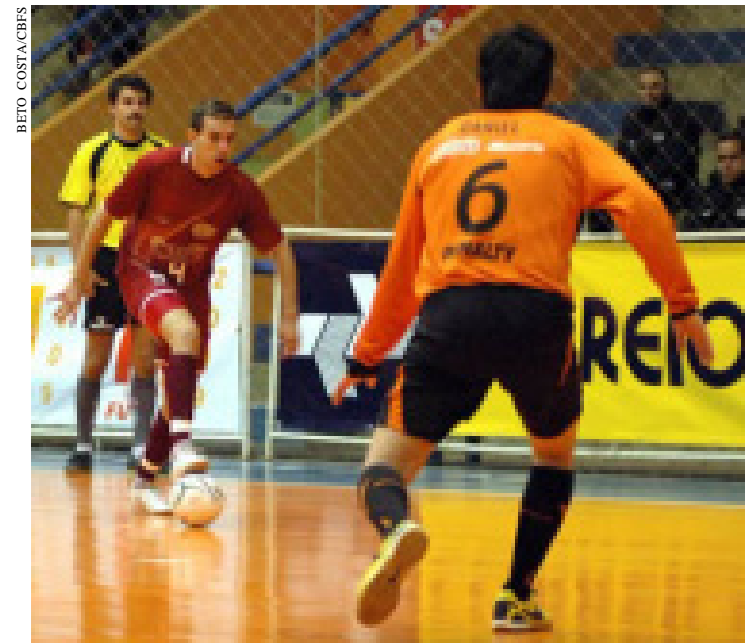
Lance de Intelli de Orlândia e ACBF no primeiro turno da Liga

Por fim, no dia 1º de outubro, às 15h30, a Intelli, segunda colocada no grupo A, recebe o Carlos Barbosa (RS), primeiro do B, no ginásio Maurício Leite Moraes, em Orlândia, interior de São Paulo. O jogo da volta será no dia 10 de outubro, às 19 horas, no Centro Municipal de Eventos, no interior do Rio