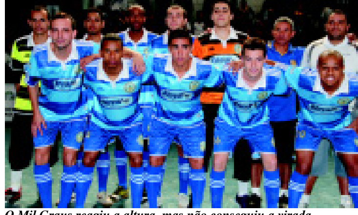
O Mil Graus reagiu a altura, mas não conseguiu a virada